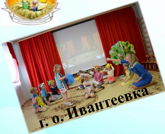
г. о. Ивантеевка