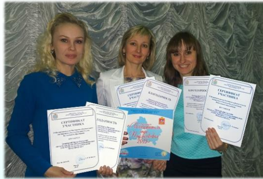
г. Кинель Самарская область